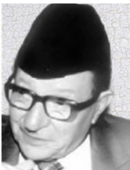
د. علي الوردي