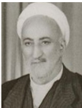
جميل صدقي الزهاوي